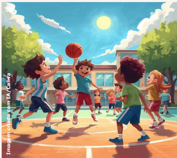
Imagem criada com IA/Canva

Qualidade das sínteses dos grupos e das relações construídas entre regras, participação e justiça.