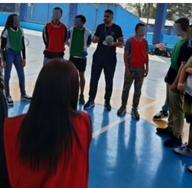
1º TEMPO ACORDO DAS REGRAS

3º Tempo: (Pós-Jogo) Após o apito final, os times se reúnem novamente. O resultado não é definido apenas pelos gols ou pontos técnicos. O grupo avalia se os acordos do 1º tempo foram cumpridos. É contabilizado as pontuações extras de cada equipe através dos pilares da metodologia: Respeito, Cooperação e Solidariedade.