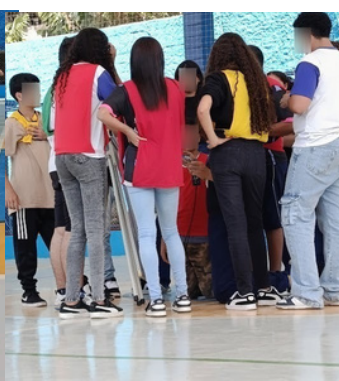
3º TEMPO CONTAGEM DOS PONTOS