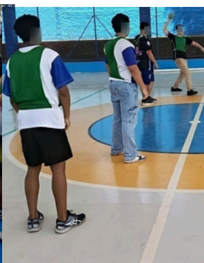
2º TEMPO JOGO